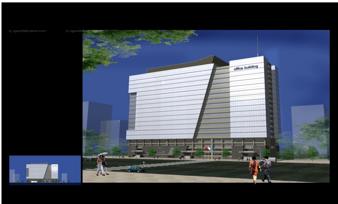
Hình ảnh minh họa toà nhà 19 tầng tại cổng Cảng số 3-Cảng Hải Phòng

DVC cũng đang tiến hành các bước để lập kế hoạch xây dựng trung tâm thương mại tại 2B Hoàng Diệu (Diện tích mặt bằng hơn 3000 m 2 ), số 4 Lê Thánh Tông (Diện tích mặt bằng hơn 3.000 m 2 ) để khai thác tốt quỹ đất vốn có của Công ty. Tuy nhiên, do các khu đất này thuộc vào dự án của thành phố nên hiện tại đang tạm dừng và chưa triển khai.