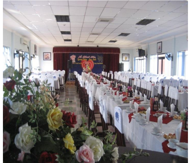
Hình ảnh Khách sạn Thăng Lợi - Địa chỉ: Số 3 Lê Thánh Tông, Ngô Quyền, Hải Phòng