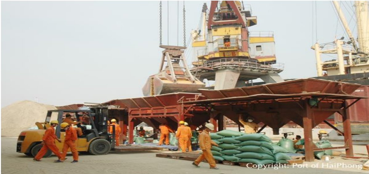
Hình ảnh công nhân bốc xếp của Công ty tại Cảng Hải Phòng

Công ty luôn ý thức được tầm quan trọng của đội ngũ cán bộ công nhân viên trong việc đảm bảo tiến độ công việc và hiệu quả công việc. Khối bốc xếp bao gồm 4 đội công nhân, tham gia trực tiếp vào các dây chuyền bốc xếp của Cảng. Nhờ có đội ngũ quản lý chuyên nghiệp, công nhân bốc xếp được đào tạo quy củ, Công ty luôn giữ vững được thế mạnh so với các doanh nghiệp cùng ngành.