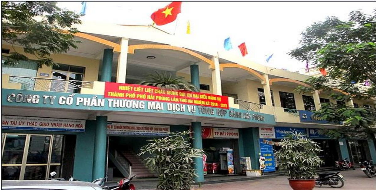
Hình ảnh trụ sở Công ty