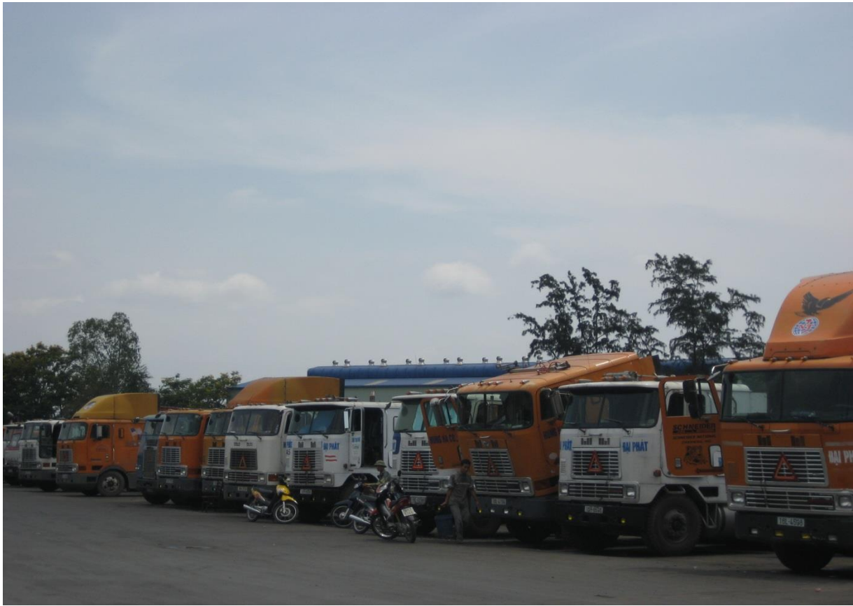
Hình ảnh Bãi ô tô - Địa chỉ: Công Cảng 1, Lê Thánh Tông, Ngô Quyền, Hải Phòng