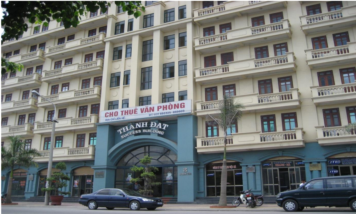
Hình ảnh Tòa nhà văn phòng cho thuê Thành Đạt

Địa chỉ: Số 3 Lê Thánh Tông, Ngô Quyền, Hải Phòng