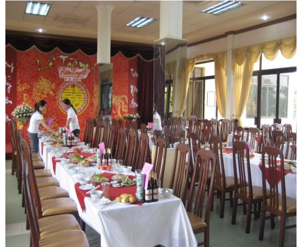
Hình ảnh Nhà hàng Cảng - Địa chỉ: 2B Hàng Diệu, Hồng Bàng, Hải Phòng