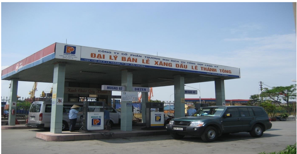
Hình ảnh Cửa hàng Xăng dầu Lê Thánh Tông Địa chỉ: Cổng 2, Cảng Hải Phòng

Công ty có các cửa hàng bán lẻ xăng dầu tại khu vực Cảng Hoàng Diệu, Lê Thánh Tông nhằm cung cấp nhiên liệu cho hoạt động của cảng và các khách hàng khác. Các cửa hàng bán lẻ xăng dầu được đặt tại các vị trí thuận tiện, nơi lưu thông xe cộ với mật độ cao nên doanh thu từ hoạt động này luôn chiếm tỷ trọng lớn, đạt chỉ tiêu kế hoạch hàng năm. Mặt khác, Công ty luôn chủ động trong việc tìm kiếm khách hàng, xây dựng mối quan hệ lâu dài với nhiều bạn hàng nên lợi nhuận ở khu vực này tương đối ổn định và có xu hướng tăng dần.