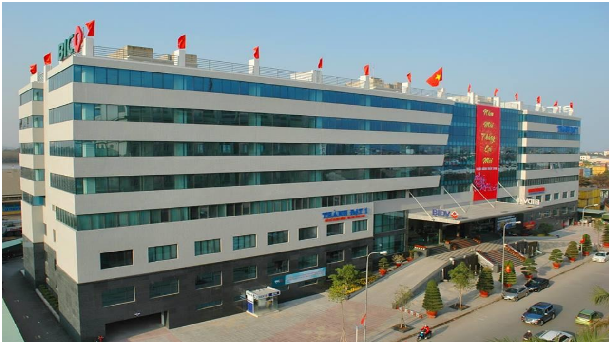
Hình ảnh tòa nhà Thành Đạt 1

Vị trí tòa nhà nằm tại cảng chính Cảng Hải Phòng với lưu lượng hàng hóa bốc xếp tấp nập, tàu bè ra vào nhộn nhịp. Từ đây chỉ với 10 phút có thể tới sân bay Cát Bi trên tuyến đường giao thông thuận tiện, 5 phút để vào trung tâm và gần với các trụ sở hành chính của thành phố. Vị trí đắc địa cùng giao thông kết nối thuận tiện, Tòa nhà Thành Đạt 1 là một trong những địa điểm đặt văn phòng lý tưởng của nhiều cơ quan, doanh nghiệp, ngân hàng... trong và ngoài nước.